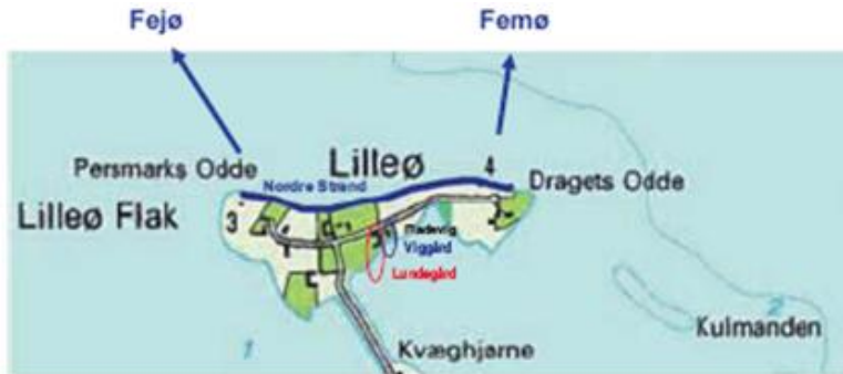
Den blå linie viser den oprindelige Lilleø.

for at komme frem og tilbage til de enkelte gårde og huse på Lilleø, hvor hver beboelse den gang havde en markvej eller sti ned til nordre strand.